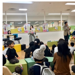
堺東高島屋での「まちなかコンサート」