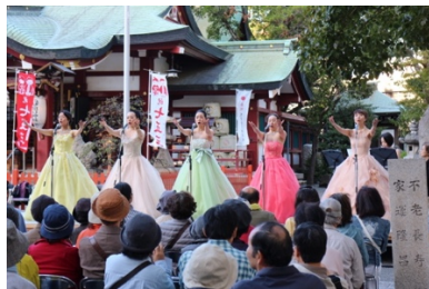
開口神社での「まちなかコンサート」