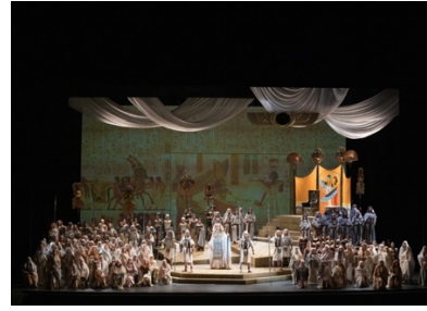
第34回定期公演『アイダ』