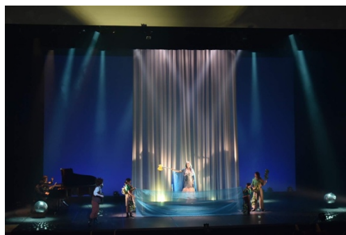
2018年度 「子どもオペラぶら座」