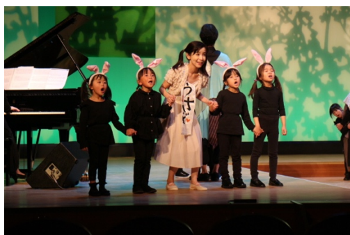
2019年度 ウェスティミラクル 『森は生きている』

オペラは音楽、文学、演劇、美術、舞踏などの複数の分野の芸術の混在によって創造される一つの統一された総合芸術であり、一度に様々な分野の芸術に触れることができます。歌手、演奏家、スタッフによるハイレベルな公演を通して、非日常的な物語がステージの上で息吹きを吹き込まれ歌と演劇を通して現実に存在するものとなります。その非日常的な体験を通してこれからの21世紀のグローバル市民として社会を生き抜くスキルである 4C. (Communication, Critical Thinking, Creativity, Collaboration)を成長させる事ができます。またそれに付随するレクチャーリサイタルやワークショップなどを通してオペラにまつわる様々なことについて学ぶ機会を設けています。オペラを普及させるためにハイレベルな公演をたくさん提供することはもちろんですが、そこに社会に必要とされる新しい付加価値を見いだすことで、今までオペラに関心が無かった方々に知ってもらえるようにしています。